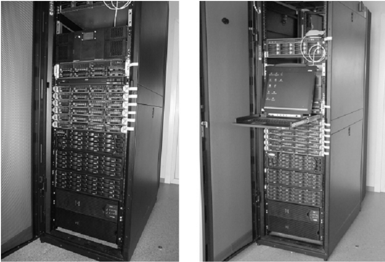
Рис. 2. Внешний вид вычислительного комплекса.