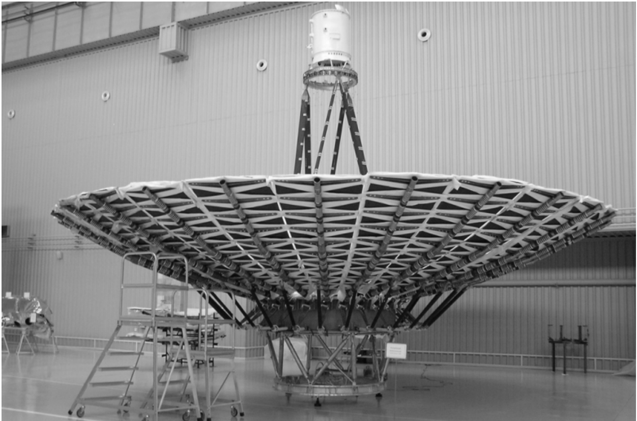
Рис.3. Раскрывающаяся антенна спутника Радиоастрон диаметром 10м, на испытаниях в НПО им. Лавочкина (2008 г.)